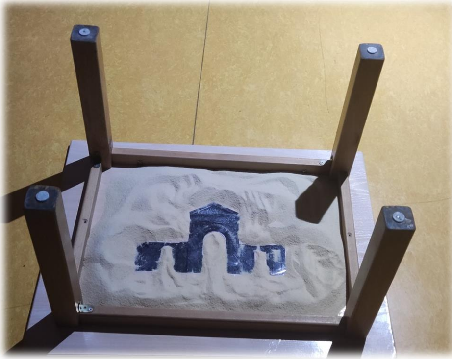
PUERTA DE MADRID (EDIFICIO DE ALCALÁ)